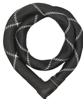
ABUS 8210 Iven