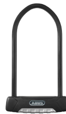
ABUS 470 Granit Plus