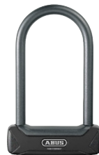
ABUS 640 Granit Plus 230 mm