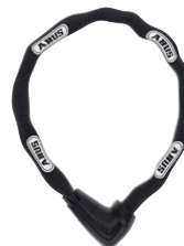
ABUS Steel-O-Chain 9808K X-Plus & 9809K X-Plus