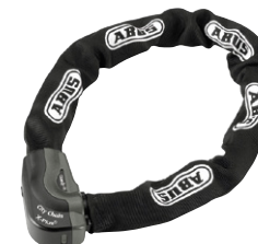
ABUS 1060 City Chain X-Plus