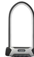
ABUS 540 Granit X-Plus