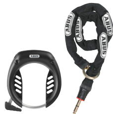
ABUS Ringlås med kæde 4650, 4750, 5755, 5955 & 6950