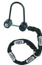
ABUS 5000 Protectus med kæde