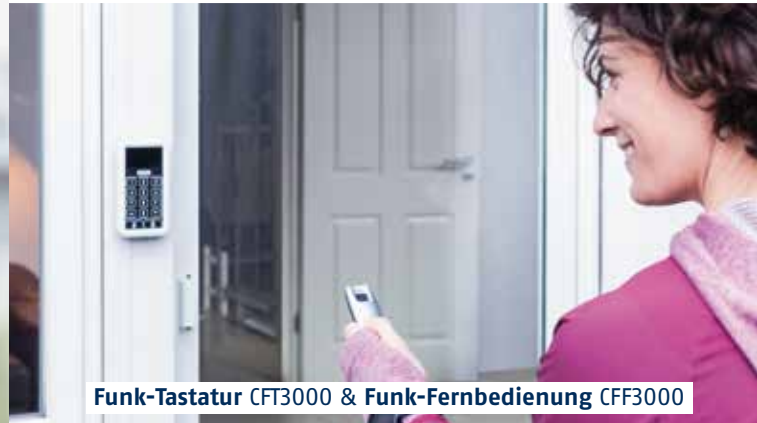
Funk-Tastatur CFT3000 & Funk-Fernbedienung CFF3000